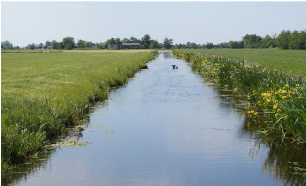
Zo kan het ook, het ene jaar de ene kant en het andere jaar de andere kant

Ecologisch slootschonen wil zeggen dat bij het schonen rekening wordt gehouden met de flora en fauna in de sloot. Door het juiste materiaal op de juiste werkwijze in te zetten krijgen slootdieren de kans om te vluchten. Een deel van de waterplanten mag in de sloot blijven staan en tijdens het schonen worden wortels zo min mogelijk beschadigd. Door het slootmateriaal niet in de talud maar op of over de insteek af te zetten is er minder uitspoeling van voedingsstoffen naar de sloot.